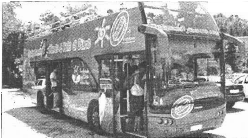
Naturalmente Cilento, al via da domani, si protrarrà fino al 12 settembre con 18 itinerari