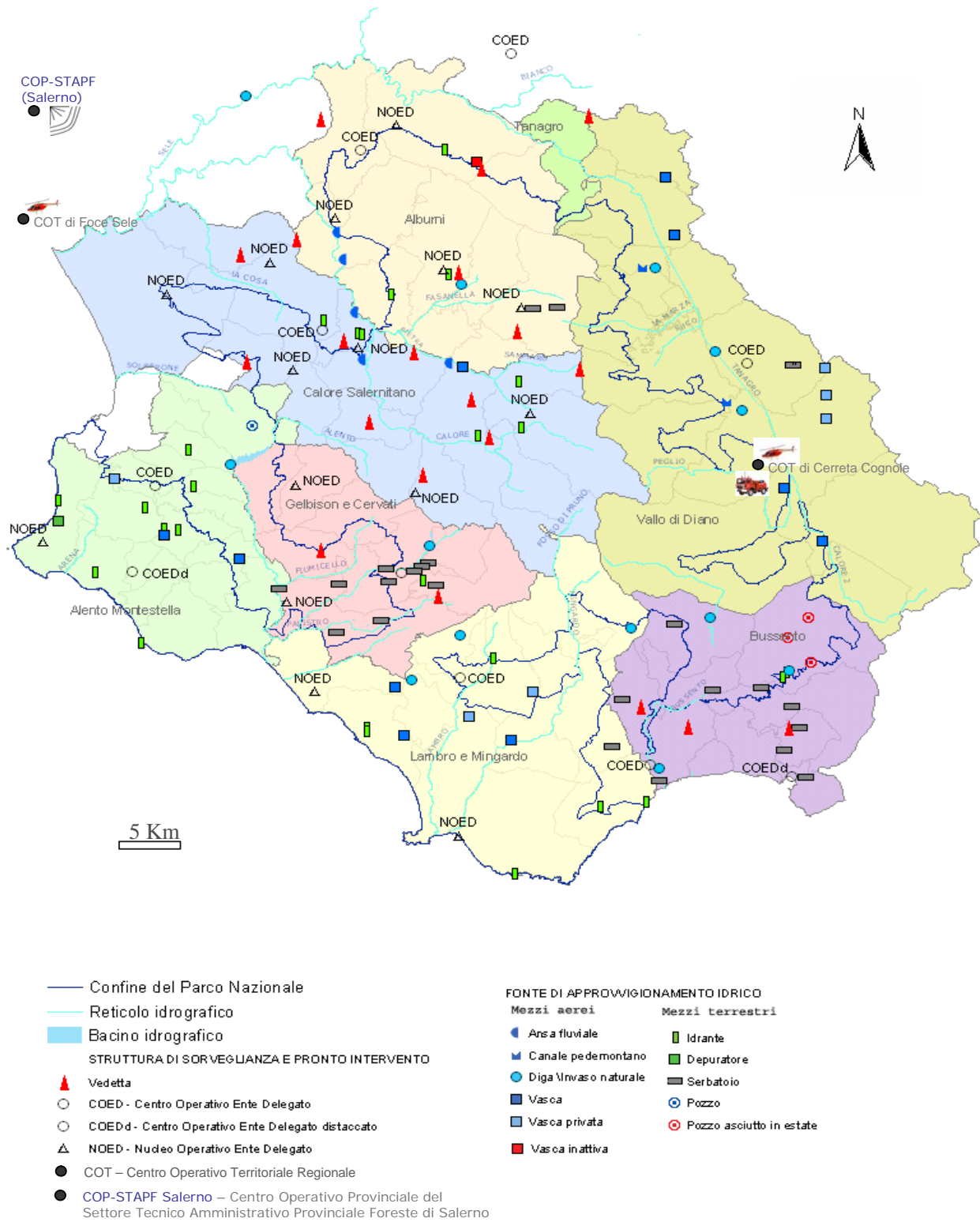
Fig. 2: Dislocazione delle strutture di lotta regionali e degli enti delegati e punti di approvvigionamento idrico.