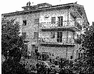
La sede della Comunità montana "Calore"

Roccadaspide, Cembalo punta il dito contro le convenzioni con tecnici esterni