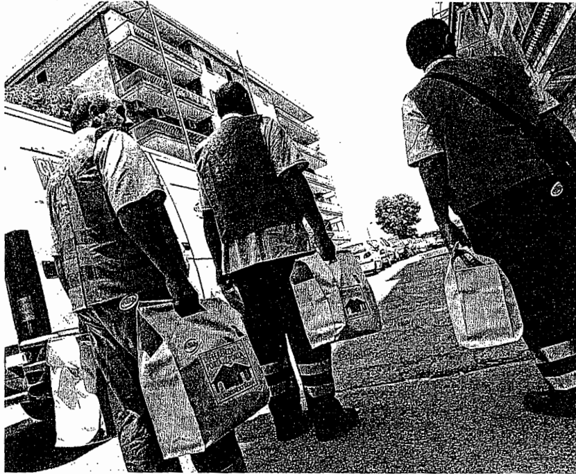
Ambiente Operatori dell'Asia distribuiscono attrezzature per la raccolta differenziata

Si annuncia, però, anche l'apertura di nuove discariche. A proposito dei termovalorizzatori, invece, la quantità annua di rifiuti da bruciare viene fissata in un milione e 531 tonnellate tenendo conto anche dei materiali residui dalla differenziata. La loro localizzazione, si ricorda, è stata fissata da leggi nazionali e potrebbe quindi essere modificata se