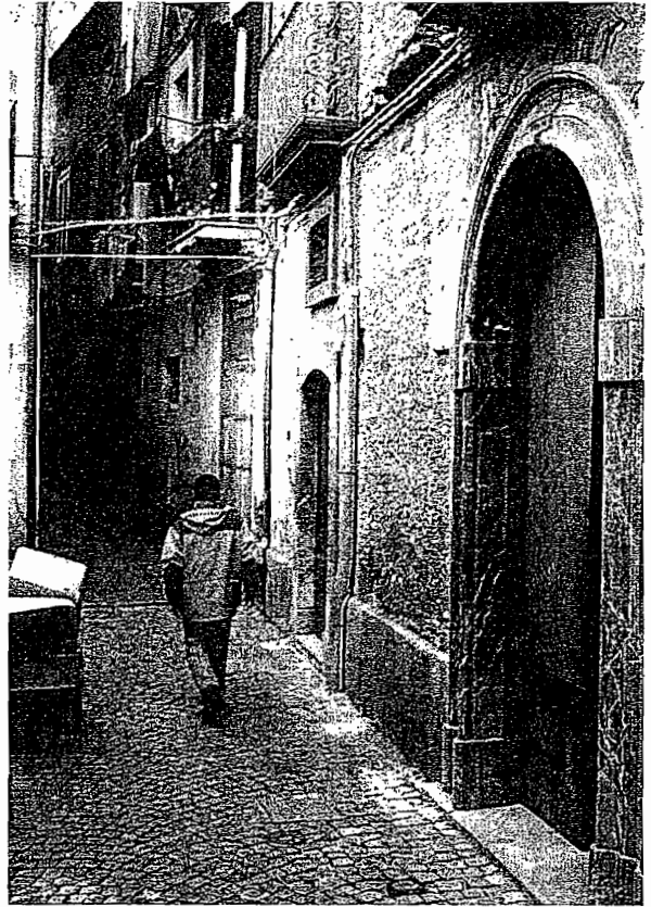
La politica La sede del Municipio di Pisciotta

Le famiglie Nei piccoli centri in campo figli e parenti di personaggi che hanno già amministrato